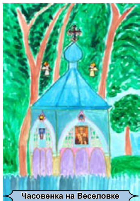
Часовенка на Веселовке