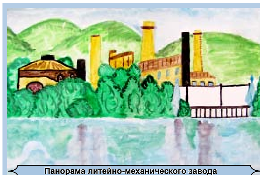
Панорама литейно-механического завода