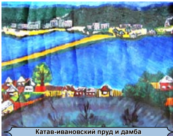
Катав-ивановский пруд и дамба

Текст Александры КУЗОВЕНКОВОЙ, 10 класс, Рисунок Никиты МИКЕРИНА, 1 класс.