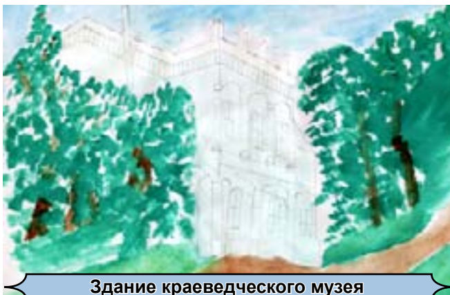
Здание краеведческого музея

Дятел, поселившийся на голубых елях в центре Катав-Ивановска, стал символом города. Он трудился и день и ночь, добывая себе пропитание из шишек. В результате снег под тополями, где у него была «столовая», оказался усыянным раскрытыми шишками.