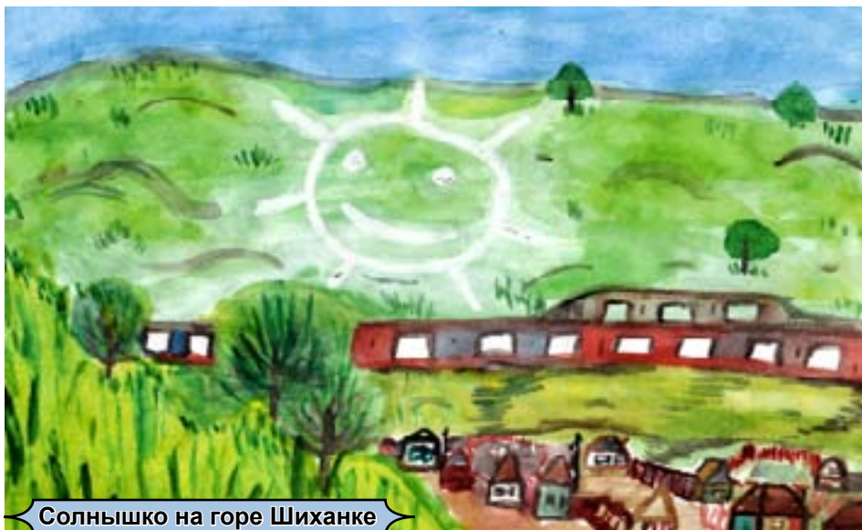
Солнышко на горе Шиханке

Дождавшись ночи темной, мальчишка забрался в дом купца и нашел камень. Купец был не глуп, подозревал о том, что может случиться. В эту ночь он подкараулил мальчишку и поймал его. Когда воришка пытался выпрыгнуть из окна,