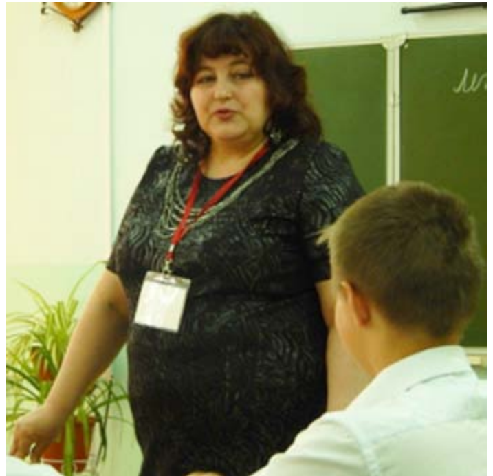
Текст Арины МАКШАНЦЕВОЙ, 10 класс, фото Полины ВЛАСОВОЙ, 9 класс.

Пообщавшись с таким интересным и разносторонним человеком, я поняла, что не зря пробежала всё утро.